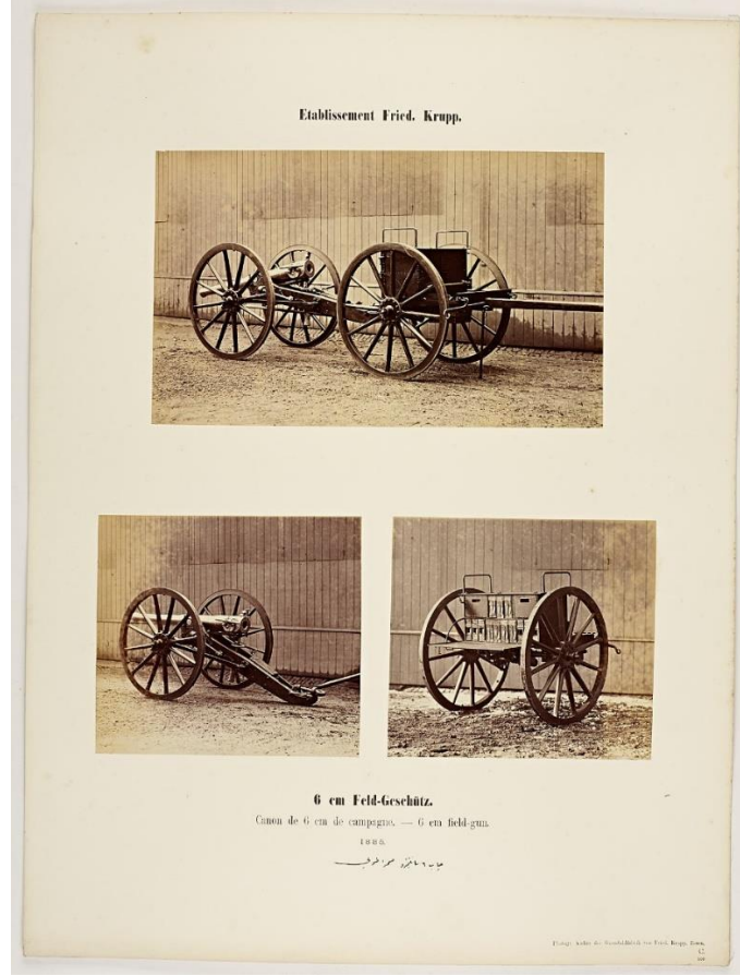
Şekil 2: Krupp topu